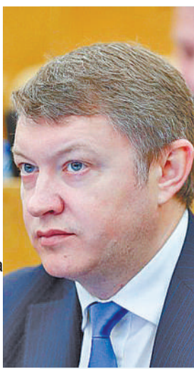
изданию депутат ГД РФ Евгений Марков.

Исходя из последних данных Росстата, в России впервые с 2016 года зафиксировано сокращение пенсий в реальном выражении. Номинально пенсии стали больше на 835 руб., или 5,6 % год к году, но даже официальная инфляция за пару месяцев выросла до 5,8 % и в итоге перекрыла рост. На самом деле покупательная способность пенсий по базовым продовольственным товарам, на которые у пенсионеров уходят почти все деньги, упала и вовсе в разы. Покупательная способность пенсий по макаронам сократилась на 7,7 %; по куриному мясу – на 7,4 %, по подсолнечному маслу – на 21 %, по яйцам – на 22,6 %, по овощам –